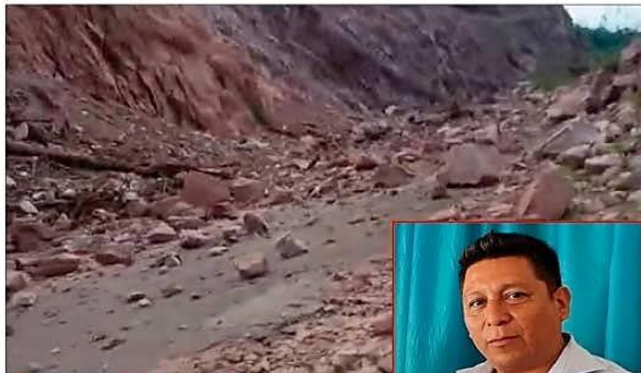
Emergencia vial en el sur del país