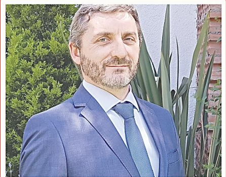
EMBAJADA DE FRANCIA