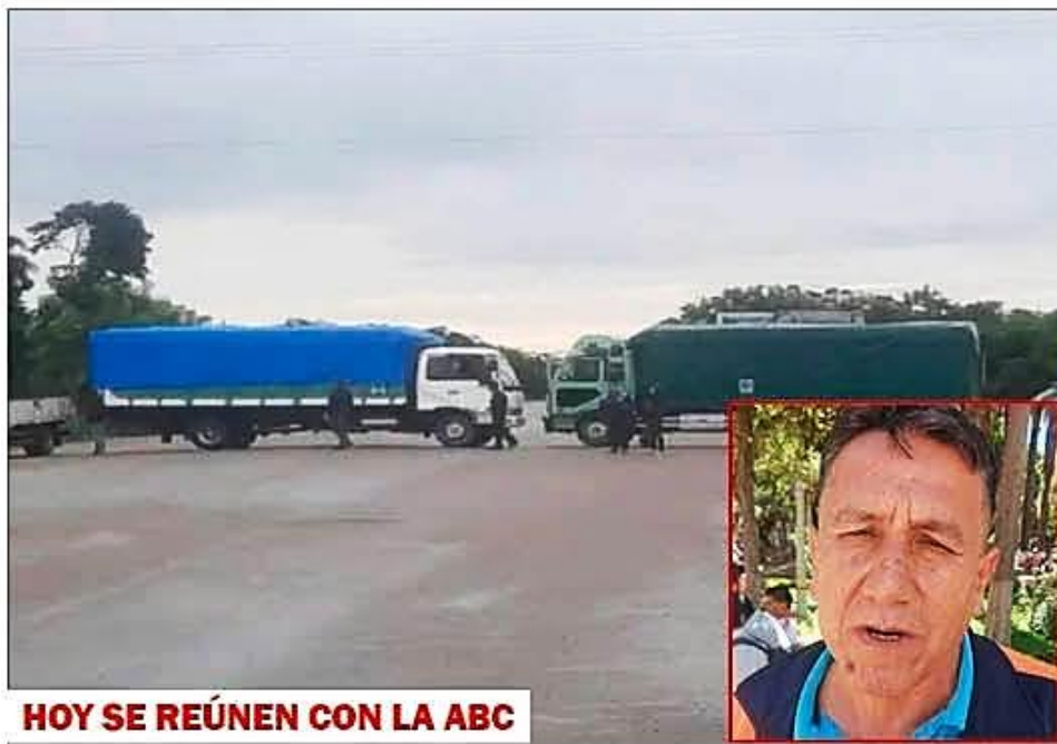
HOY SE REÚNEN CON LA ABC