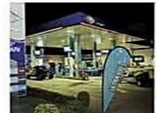
Se acordó impulsar mesas técnicas y avanzar en atender las demandas

Una reunión entre Asosur e YPFB permitió desactivar el estado de emergencia y el cierre temporal de surtidores NACIONAL PÁG 6