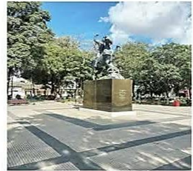
El Control Social y Fejuve, van perdiendo su rol en Montero

Lío. La confrontación y la búsqueda de protagonismo se han convertido en la moneda corriente que alientan la creación de entes vecinales paralelos