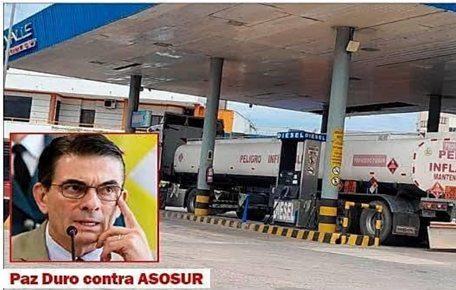
Paz Duro contra ASOSUR