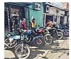
El sector local afirman que se está cumpliendo con la compensación

Los mototaxistas del Norte Integrado descartan sumarse al bloqueo que anuncian sus pares de la capital cruceña por la gasolina en mal estado NEGOCIOS PÁG 5