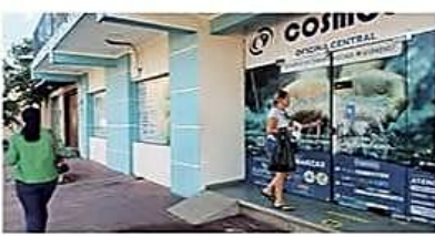
Cosmol RL llevará el tema a una asamblea para definir las acciones a seguir

Avances. Una auditoría sustenta la denuncia de la que se informó se tiene como presuntos responsables a cinco funcionarios. PÁG 3