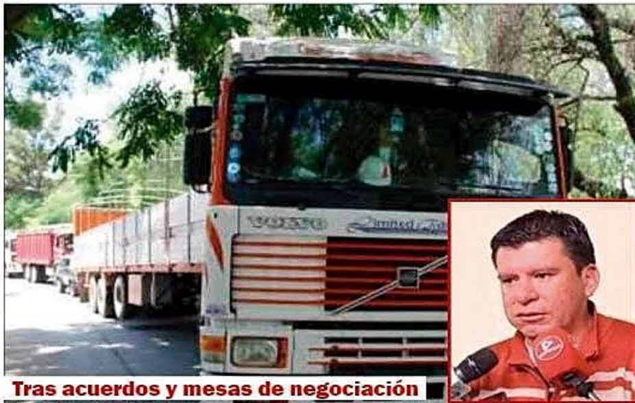
Tras acuerdos y mesas de negociación