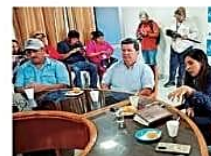
El directorio de Cosmol RL, pidió apoyo a proyectos de desarrollo

La viceministra de Medio Ambiente visitó la cooperativa monterreña para conocer su potencial y dificultades CIUDAD PÁG 3