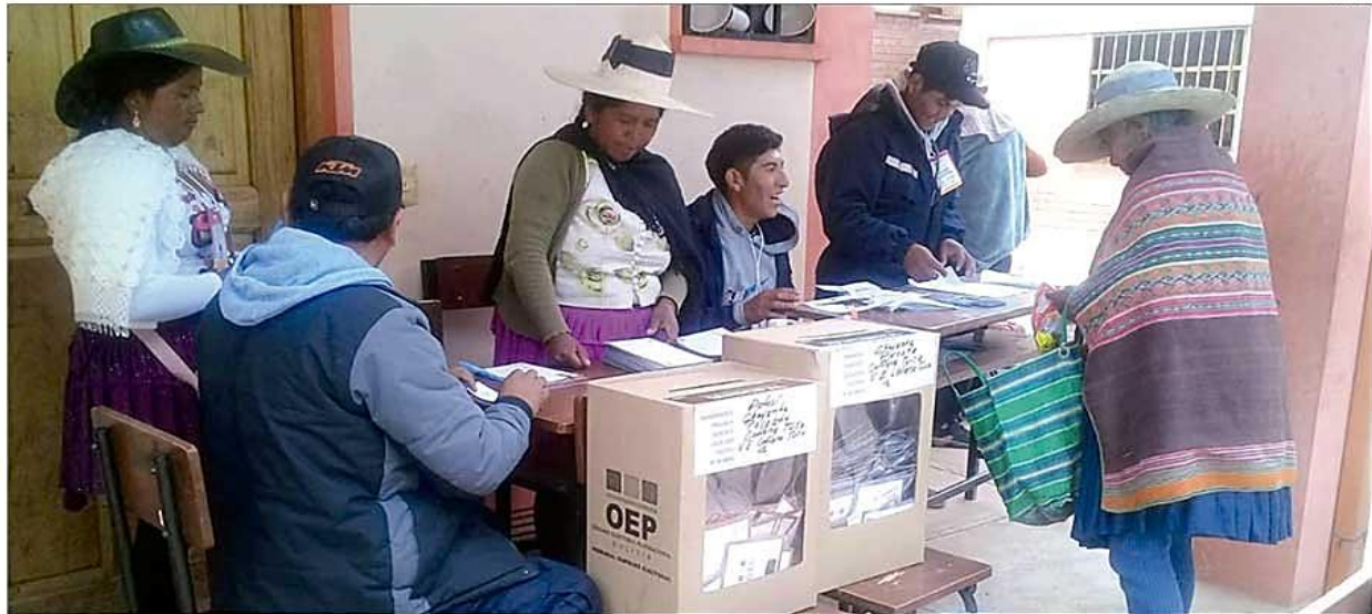
La elección desarrollada en el área rural del Departamento.