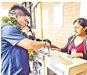
LOZA VOTANDO. IBC