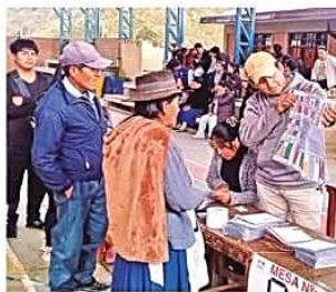
FILAS PARA SUFRAGAR EN POTOSÍ. ISE