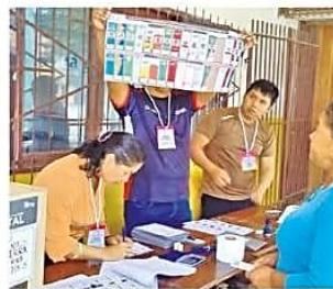
JURADOS MUESTRAN LA PAPELETA. ISE