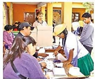
ELECTORES EN TARIJA. ISE