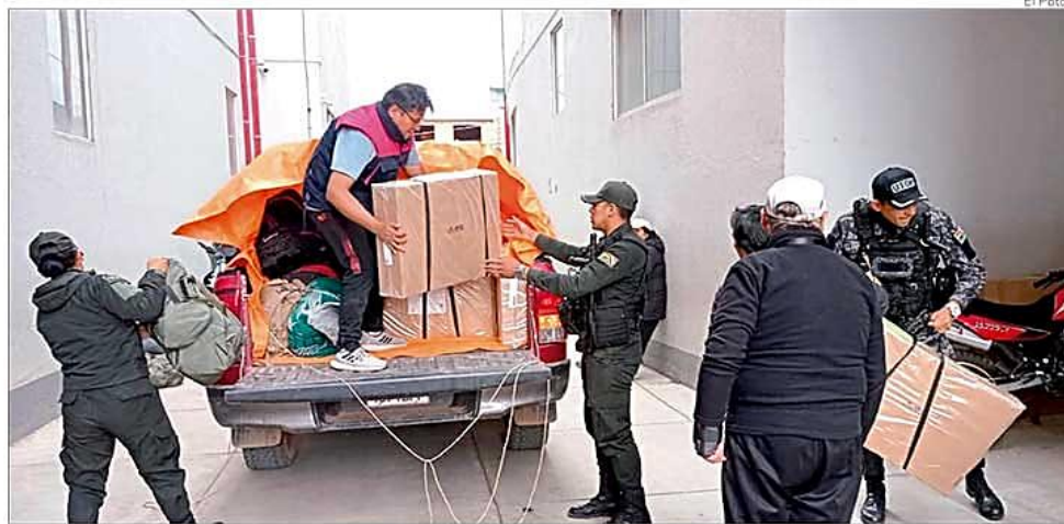
La llegada de las maletas electorales al edificio del TED.

► Se estableció que la consulta se realizaría en Beni, Chuquisaca, Oruro, Tarija, Cochabamba, Santa Cruz y La Paz. A-10