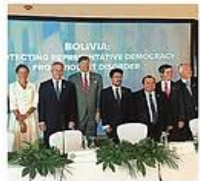
Los representantes de los 14 países que firmaron el acta

Rechazo. A través de la declaración conjunta, estos gobiernos rechazaron las acciones promovidas para afectar la democracia y la paz en el país. PÁGS