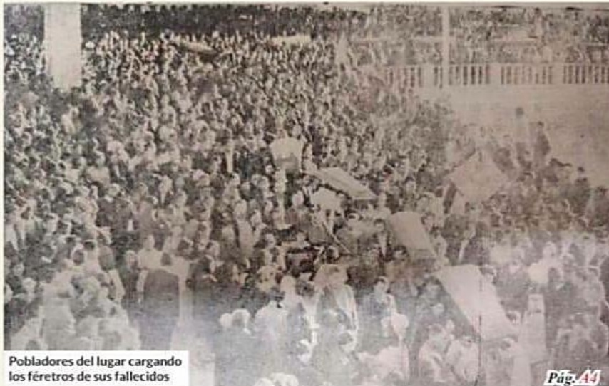
Pobladores del lugar cargando los féretros de sus fallecidos