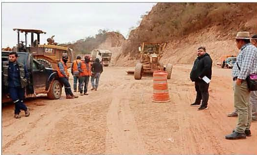
"LAMENTABLEMENTE ESTAMOS CORRIENDO CONTRA EL TIEMPO"