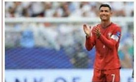
El luso marcó un doblete en el triunfo de Portugal ante Uzbekistán; Messi, Mbappé, Haaland y Kane también van por la Bota de Oro