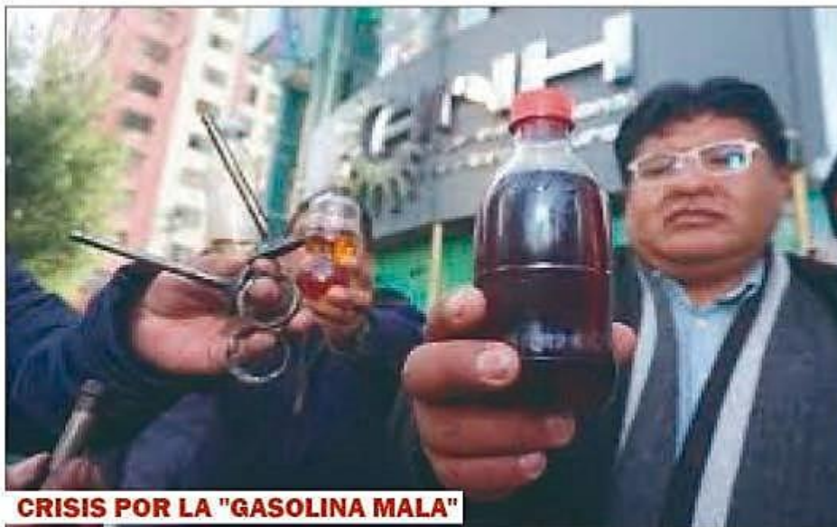
CRISIS POR LA "GASOLINA MALA"