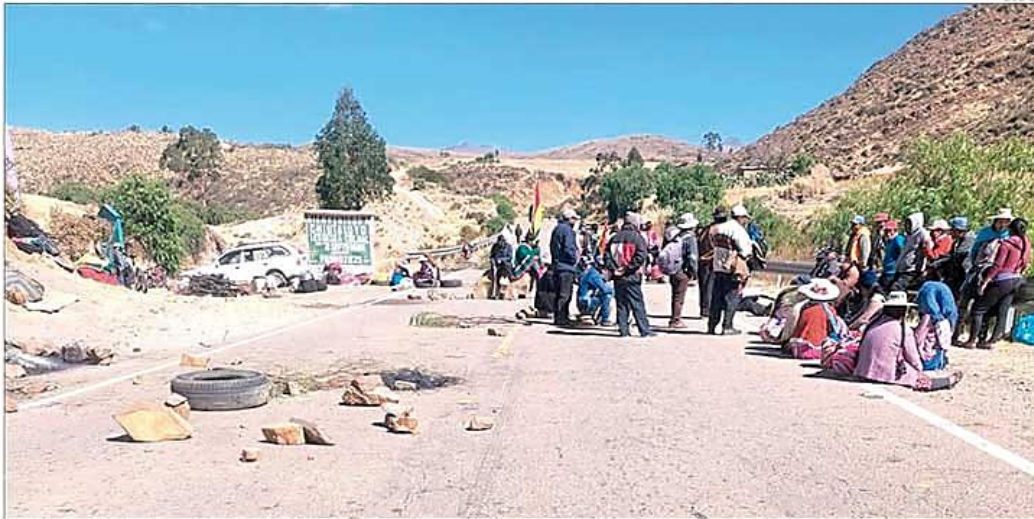
Uno de los puntos de bloqueo en el Departamento de Potosí.

La población potosina recibe 300 litros segundo de las lagunas del Kari Kari y la aducción río San Juan. A-7