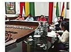
El alcalde además argumento que existe un proceso por la tutela

La ley elaborada por los concejales de oposición, fue devuelta por el alcalde por ser una norma 'inconstitucional'. CIUDAD PÁG 3