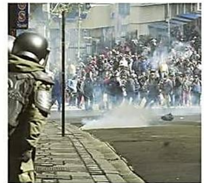
El Ejecutivo tiene una herramienta para enfrentar el conflicto

Contenido. La norma dificultaba al Ejecutivo la declaración de un estado de excepción con la finalidad de dar solución a las movilizaciones. PÁGS 5