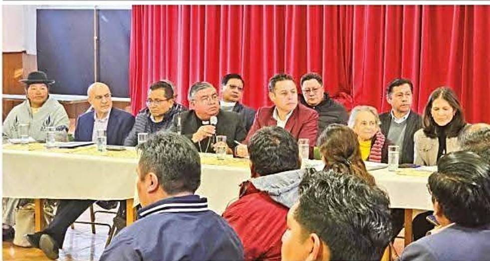
Asistentes al encuentro convocado por la Vicepresidencia en la sede definida por la Conferencia Episcopal en el seminario San Jerónimo, ayer.