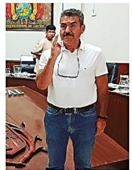
Perales, asume una nueva gestión, basándose en el reglamento vigente

Acto. Los concejales de Creemos con la presencia de tres suplentes y una titular de oposición sesionaron, eligieron y posesionaron la directiva