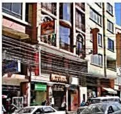
[4] Economía y empresa

[11] Al Cierre Bolivia y EEUU nombrarán a embajadores este año