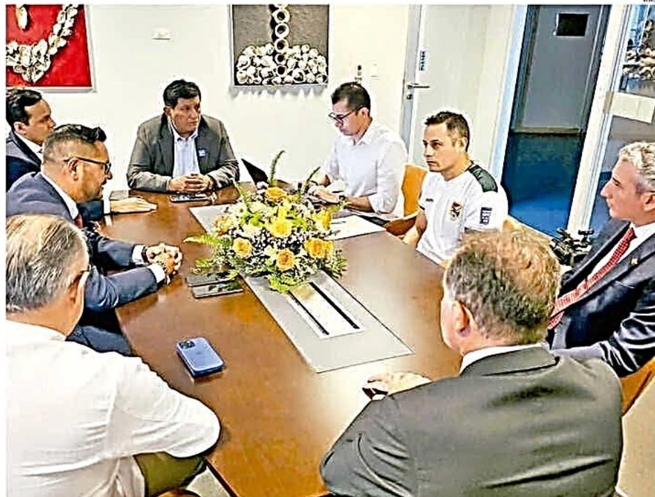
Edmand Lara viajó un día después del mandatario boliviano.

Mientras el presidente se esfuerza en cerrar acuerdos económicos, el vicepresidente estuvo con el Parlamento Andino.