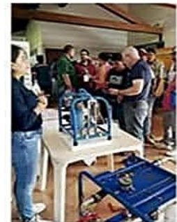
El evento además del Simposio tiene un área ferial de ofertas para el sector

Técnicos, productores, académicos y estudiantes de Bolivia y de otros países de la región, son parte de los participantes de este evento que debate las novedades de la agroindustria cañera. PÁG 3