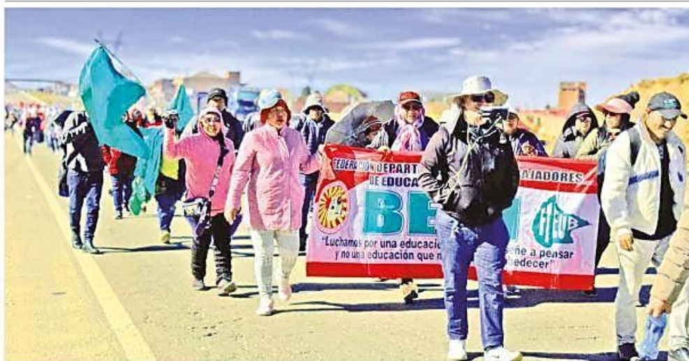
Más de un centenar de maestros marchan rumbo a La Paz en demanda de un incremento salarial y mayor presupuesto para educación.