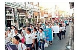
La marcha contó con importante apoyo de los educadores locales

Maestros del Norte Integrado marcharon en Montero en contra de la descentralización de la educación en el país CIUDAD PÁG 4