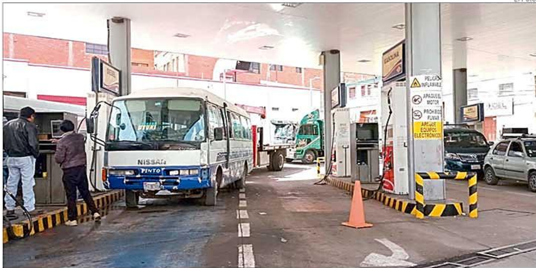
Las filas crecen en los surtidores de la ciudad de Potosí.

► Demandan regularizar las ventas de carburantes, frenar la gasolina mala y arreglo de las carreteras: los potosinos apoyarán la movilización definida. A-8