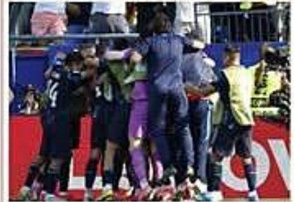
En el partido de 16avos de final, se disputó este lunes en el Gillette Stadium de Boston